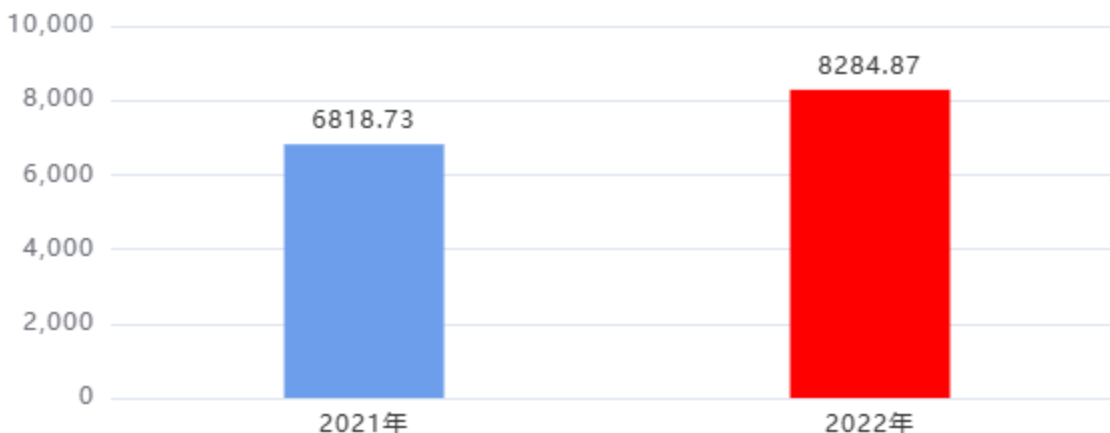
财政拨款收入、支出总计对比图 (单位: 万元)